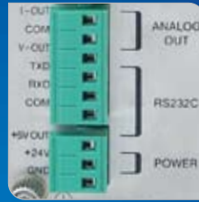
다양한 형태의 출력특성