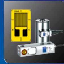
다양한 스트레인 게이지형 센서 입력 가능